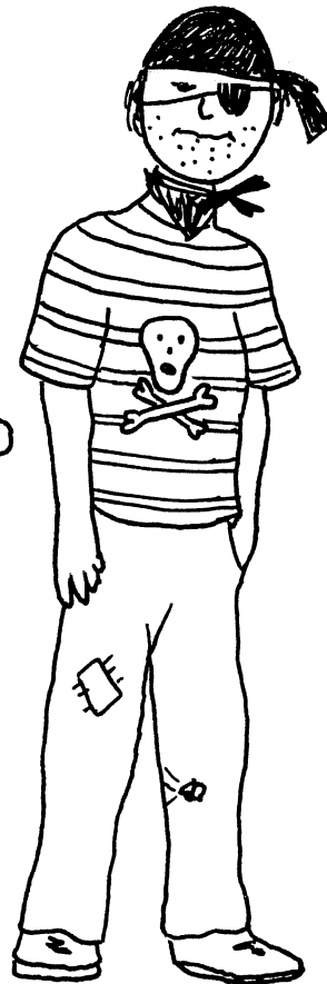
Nicklas als Pirat: